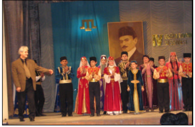
2005'te 15.kuruluş yıldönümünü kutlayan Qırım Ansambli Qurultay münasebetiyle özel bir gösteri yaptı.

Böylelikken, semetdeşlerimiz ale bu küñge qadar tikenli teller artında bulunmağa mecburlar, şovinistik matbuat ise tosatsosat qanunbozucu mahkemeniñ neticelerini meydanğa çekip çıkarıp, Qırım tatarlarğa nefret ve düşmanlıq munasebetlerini tutaştırmak için qullana. Ukraina Aliy Mahkemesi adaletli karar çıkaracağına ümüt