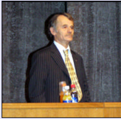
Kırımoglu: "Qırım Tatar halkının egemenlik bildirisi Sovyetler Birliği dağılmadan önce, Ukrayna devleti yokken açıklandı. Rusya Qırım'ı kendine bağlamak istemişti."

Onıñ Qırımtatarlarğa nisbeten munasebeti ve Qırım'da olğan vaziyetni añlamağanı ükümetniñ erkânı tüzülgeninde ve kadrlar meselesinde koründi. Onıñ birinci sheması boyunca S.Kunitsinnıñ ükümetine nisbeten ükümette çalışqan Qırımtatarlarınñ vaziyeti, atta fenalaştı. Ükümet erkânında öz vazifelerinde bir-qaç şovinist memur qaldı. O bunı parlament saylavları yaqınlaşa ve Qırımtatarlarınñ vaziyetini küçlendirmek, demek rustilli adamlarınñ reylerini coymaqtır, dep añlattı.