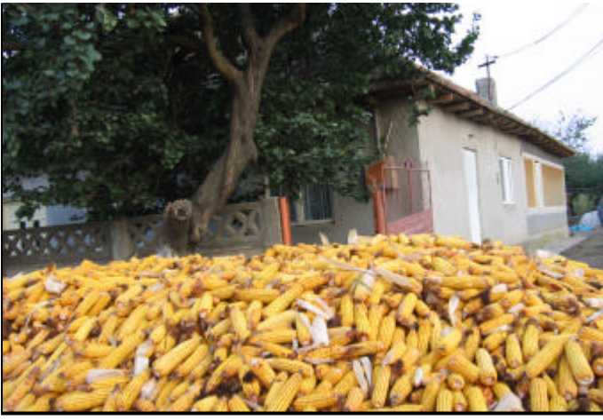
Nogay Mahallesi. Anneannemin dayısının evleri

Kızlar olarak başımızı örtmezdik. İki yandan örüp topuz yapardık. Kadınlar başlarını çemberle, başlıkla bağlardı. Çarşaf, fes yoktu. Erkekler pantolon, "kolekse", kasket giyerlerdi. Kasketi köylüler, yaşlılar poter şapka giyerlerdi.