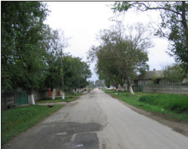
Kobadin. Alman Mahallesi